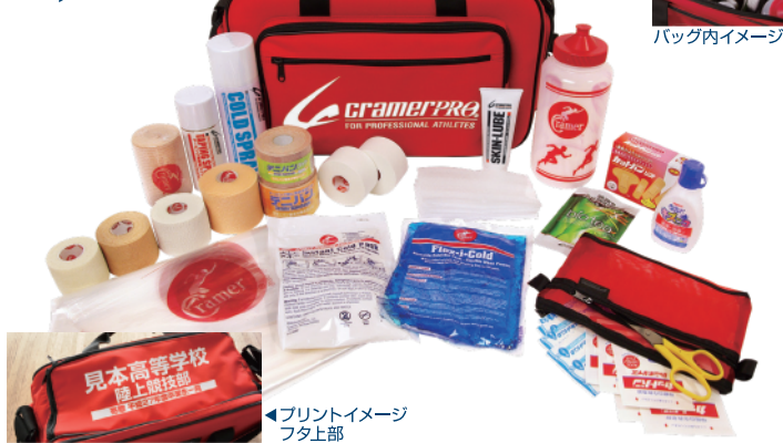
バッグ内イメージ