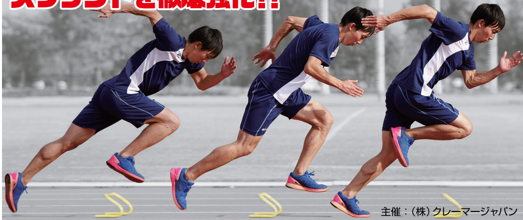
主催：(株)クレーマージャパン

日時/会場 3月3日(日) 熊谷スポーツ文化公園陸上競技場 サブトラック 9:00~12:00 受付：競技場正面付近にて8:30より開始いたします